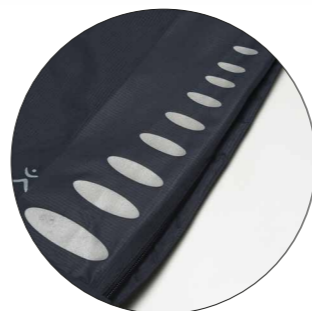
Motyw „Bubble” Nr art. 9901403 Wymiary: ok. 25 x 8,5 cm