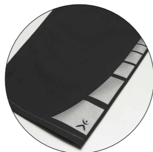
Motyw „Square” Nr art. 9901402 Wymiary: ok. 25 x 7,5 cm