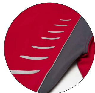
Motyw „Brush” Nr art. 9901401 Wymiary: ok. 25 x 9,5 cm

Taśma odblaskowa W celu uzyskania jeszcze lepszej widoczności doszywamy lub nadrukujemy odblaskowe taśmy, które są elastycznie dostosowywane do potrzeb klienta.