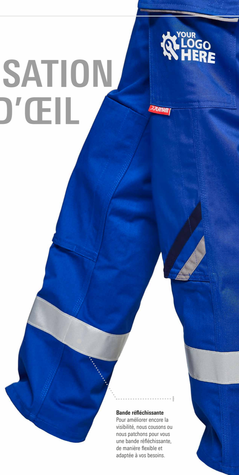
Bande réfléchissante Pour améliorer encore la visibilité, nous cousons ou nous patchons pour vous une bande réfléchissante, de manière flexible et adaptée à vos besoins.

Remarque importante : l'application de bandes réfléchissantes supplémentaires ne permet pas de considérer les vêtements correspondants comme des vêtements à haute visibilité.