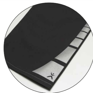
Motif „Square“ art. n° 9901402 Dimensions : ca. 2,5 x 7,5 cm