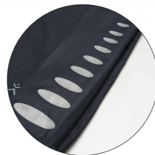
Motif „Bubble“ art. n° 9901403 Dimensions : ca. 2,5 x 8,5 cm