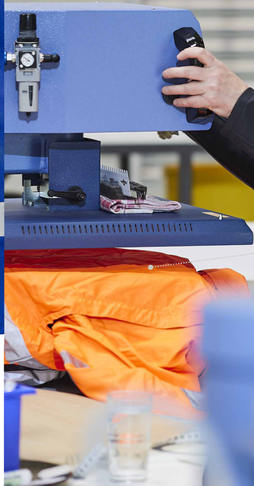
Impressions par transfert éclatantes Qu'il s'agisse d'un patch dans le dos, sur le plastron, les manches ou les jambes de pantalon, nous assurons à votre logo une visibilité maximale

Un logo personnalisé, un conseil personnalisé Nous sommes en permanence à votre disposition par téléphone, du lundi au vendredi de 8h00 à 17h00.