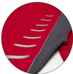
Motif „Brush“ art. n° 9901401 Dimensions : ca. 2,5 x 9,5 cm